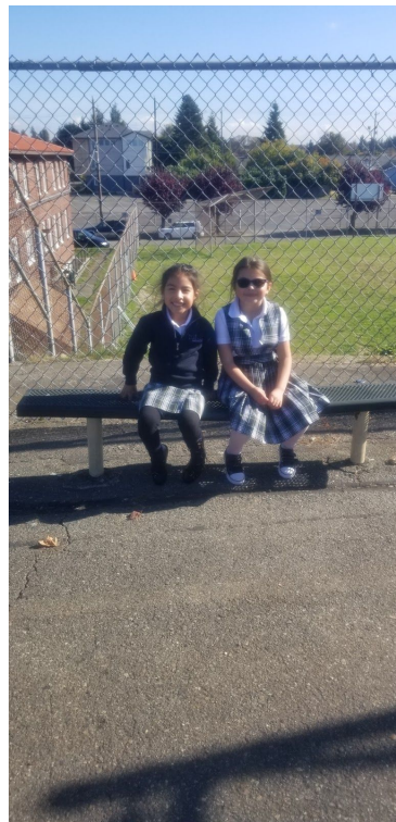
1st graders happy and safe on the playground.

Last week concluded our fall MAP testing. Teachers are working with score reports. These reports will be presented during fall conferences. Most of our parent-teacher-student conferences are held during the week of Thanksgiving with the exception of a few that are happening at the end of this month. If you would like a copy of your child's MAP scores