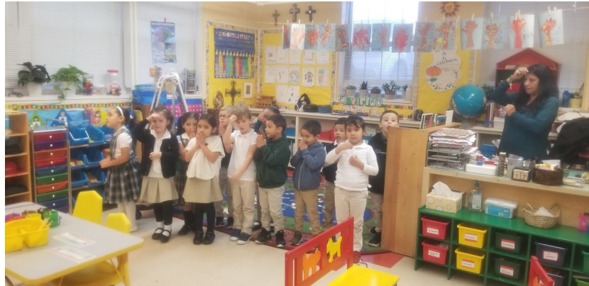
Estudiantes de PreK rezando a Mary antes de la escuela

October 18, 2019 ~ 18 de octubre de 2019