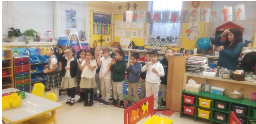
PreK students praying to Mary before school