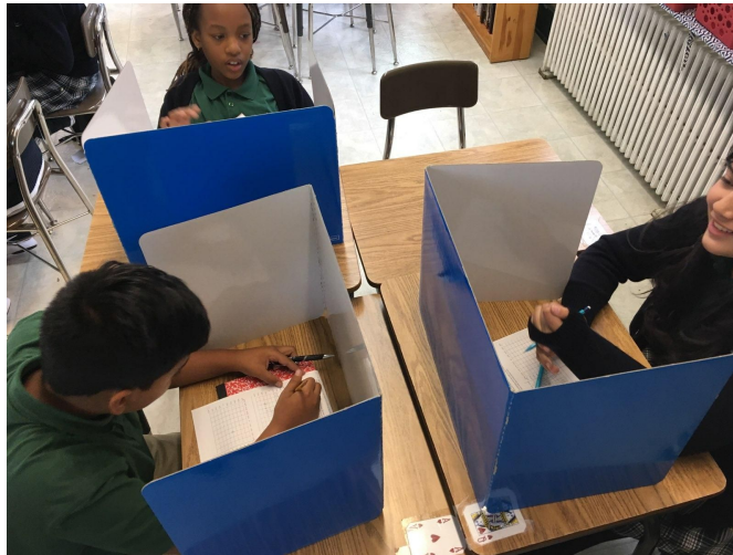
Estudiantes de sexto grado que juegan un acorazado para aprender longitud y latitud en estudios sociales.

Nuestra misión en Holy Family es crear estudiantes que sean discípulos de Cristo y aprendices de por vida, que busquen conocimiento y sepan cómo encontrar a Dios. Al igual que el sol salió de las nubes aquí en Seabeck, WA, esperamos guiar a los estudiantes a ver la luz de Cristo a medida que crecen académicamente. Gracias por apoyar nuestra misión.