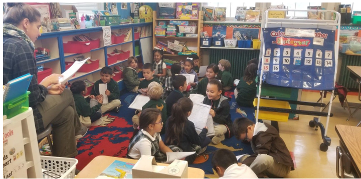
Clase de primer grado participando en la práctica de conversación en español.

el aprendizaje diario en la escuela, esperamos que haya experimentado un poco de lo que sus hijos están aprendiendo durante la Noche de Currículo. Agradecemos a los padres por tomarse el tiempo para venir y aprender sobre nuestros objetivos escolares y las aulas de los estudiantes.